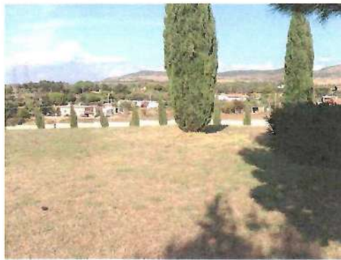
rilievo fotografico aree di intervento